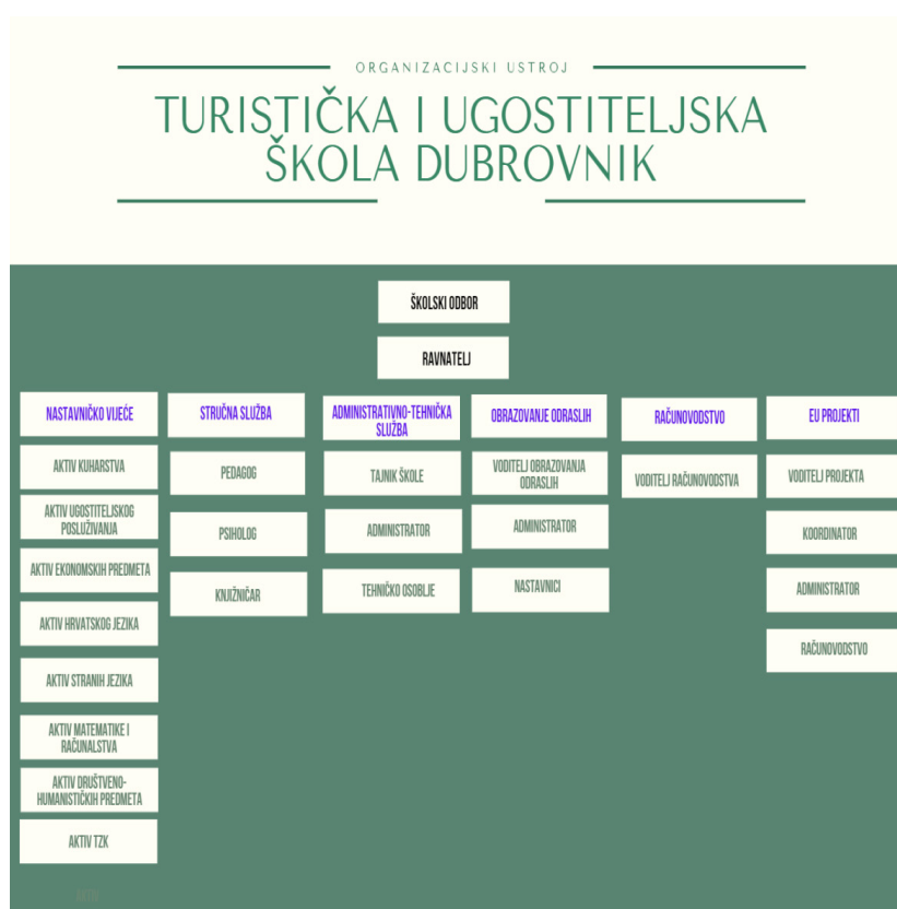
Slika 1. Organizacijski ustroj TUŠDU

60-tih godina počinje ubrzana izgradnja hotelskih kapaciteta, no potražnja s inozemnog tržišta još uvijek je bila daleko veća od ondašnjih smještajnih mogućnosti. Takvo ukupno stanje odrazilo se i na rad ugostiteljskih škola. Značajno se povećao broj učenika, a godine 1960. Ugostiteljska škola Dubrovnik otvara i treći smjer u svom obrazovanju pa se pored kuhara, konobara i slastičara u ovoj školi počinju obrazovati portiri i hotelske domaćice. 1961. godine izgrađena je današnja školska zgrada na Pločama čijim hodnicima i danas prolaze učenici ne samo s dubrovačkog područja već i cijele Dalmacije i Hrvatske. Upravo su iz dubrovačke Turističke i ugostiteljske škole potekli brojni vrhunski brojni kadrovi koji su svojim znanjem, voljom i ljubavlju proslavili hrvatsko ugostiteljstvo i turizam.